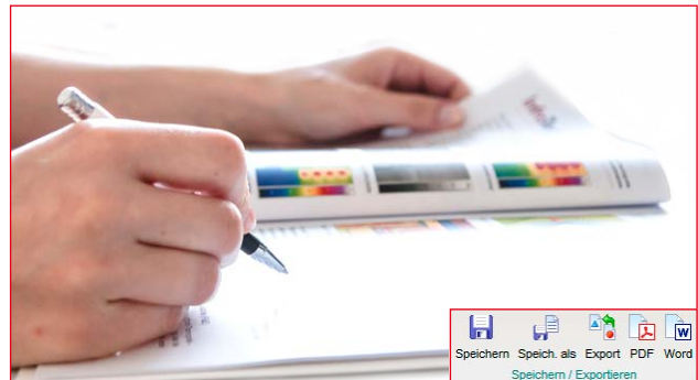
IRBIS® 3 report bietet flexible Möglichkeiten für den Export von Thermografieberichten