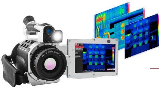
Einfache Datenübernahme via IRBIS® 3 report